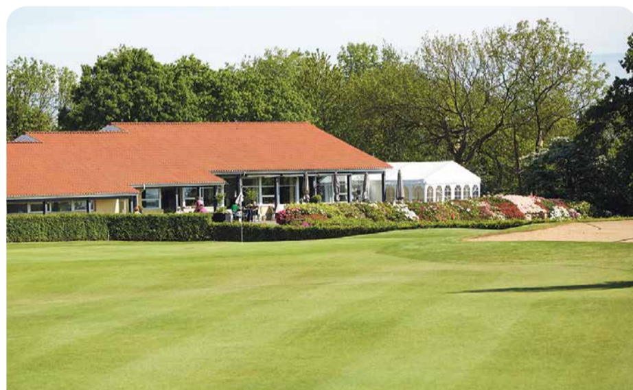
Green på hul 18 foran den blomstersmykkede klubhusterrasse er måske banens største.

Men 300 kr. for greenfee på hverdage og 400 kr. i weekenden er for billigt i forhold til banens kvalitet. Og så er det jo også et plus, at restaurant Unico har ry for at være en af de bedste gourmet-restauranter i hele Aarhus.