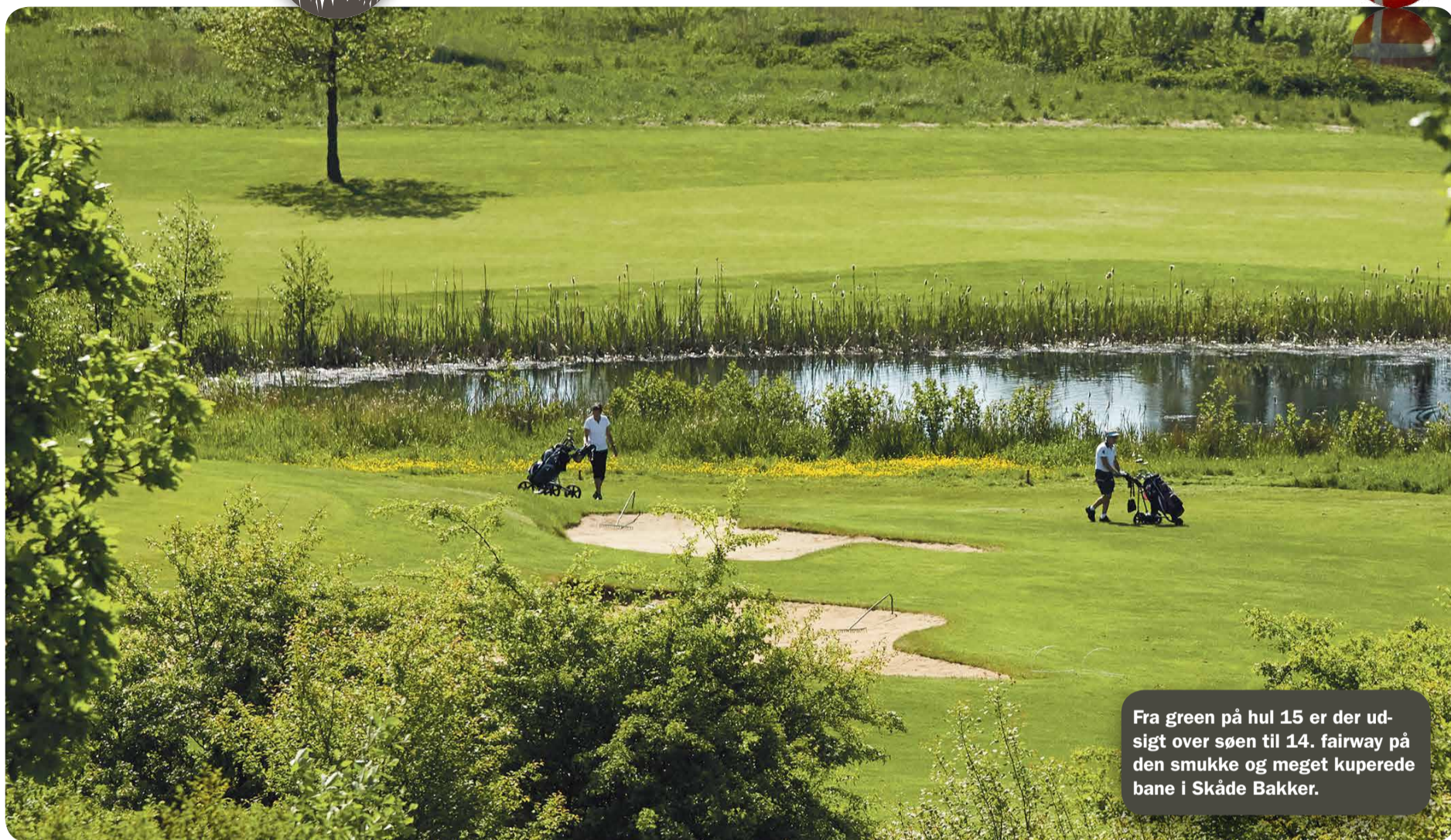
Fra green på hul 15 er der udsigt over søen til 14. fairway på den smukke og meget kuperede bane i Skåde Bakker.